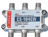
CS-104CW (2020472) 標準価格 ¥5,900 (税別)