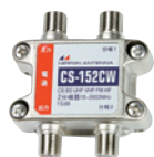
CS-152CW (2020474) 標準価格 ¥5,800 (税別)