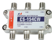
CS-154CW (2020475) 標準価格 ¥8,400 (税別)