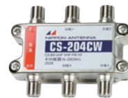
CS-204CW (2020478) 標準価格 ¥9,000 (税別)